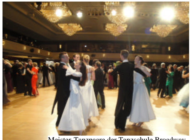
Meister-Tanzpaare der Tanzschule Broadway

Der Botschafter eröffnete festlich den Ball, der dann auf traditionelle Wiener Art mit einer Fächerpolonaise der Tanzschule Broadway und dem anschließenden Kaiserwalzer eröffnet wurde.