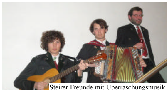
Steirer Freunde mit Überraschungsmusik

musikalisch, sprachlich, sondern auch durch smartes Aussehen, sich dem Regisseur beugen, intelligent sein, eine Vielfalt an Stimmvarianten in den einzelnen Stimmlagen gefordert. Dabei solle das wahre Singen eine natürliche Sache sein. Der Ausflug führte über einen Operettengruß aus Wien mit Johann Strauß, Franz Lehár und Nico Dostal, den man heute leider sehr selten hört zum typischen Wienerlied wie „Im Prater blüh'n wieder die Bäume..“