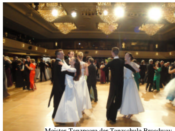
Meister-Tanzpaare der Tanzschule Broadway

Der Botschafter eröffnete festlich den Ball, der dann auf traditionelle Wiener Art mit einer Fächerpolonaise der Tanzschule Broadway und dem anschließenden Kaiserwalzer eröffnet wurde.